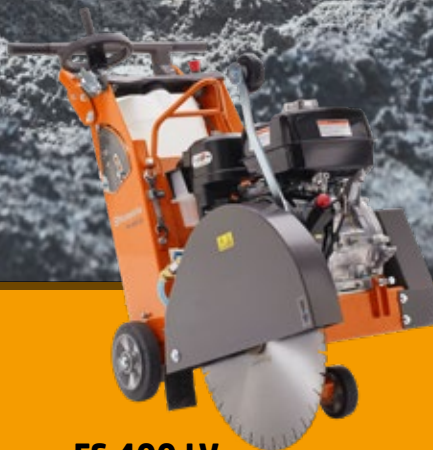
FS 400 LV

Ein benzingetriebener, anwenderfreundlicher Universal-Fugenschneider